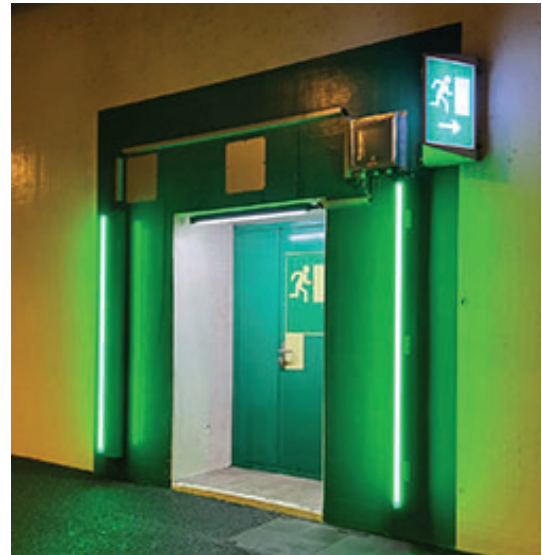
Exemple sortie de secours